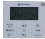
MD-KJR29B/BK (в комплекте)